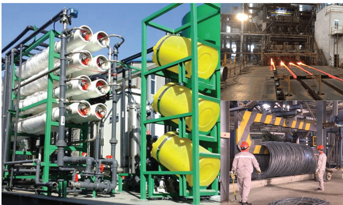
Hệ thống xử lý nước cho Nhà máy hóa chất DAP - KCN Đình Vũ, Hải Phòng