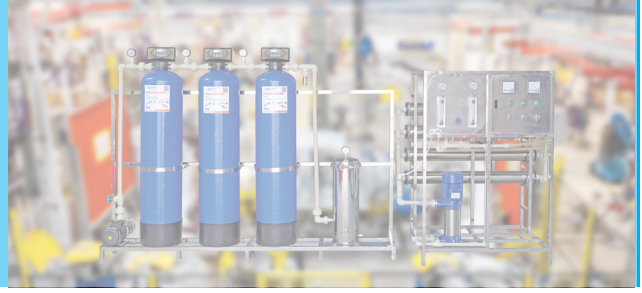
Hệ thống lọc nước RO công suất lớn cho phục vụ cho toàn bộ nhân dân và cán bộ chiến sĩ huyện đảo Bạch Long Vĩ