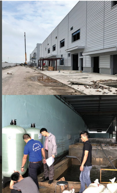
Hệ thống xử lý nước tại CTY Nhựa Phú Lâm - Dương Kinh, Hải Phòng