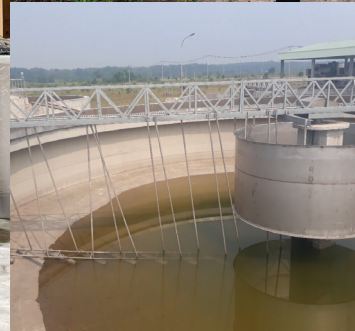
Hệ thống lọc nước phục vụ sản xuất nước làm mát, rửa kính ô tô Maxxi KCN Hoàng Đông, Hà Nam